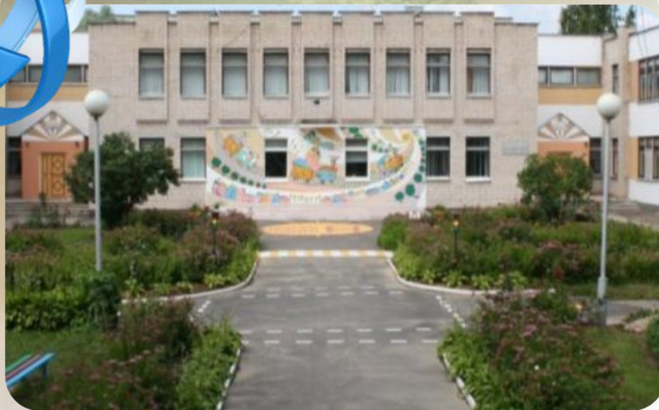
ГУО «Детский сад № 19 г. Витебска»