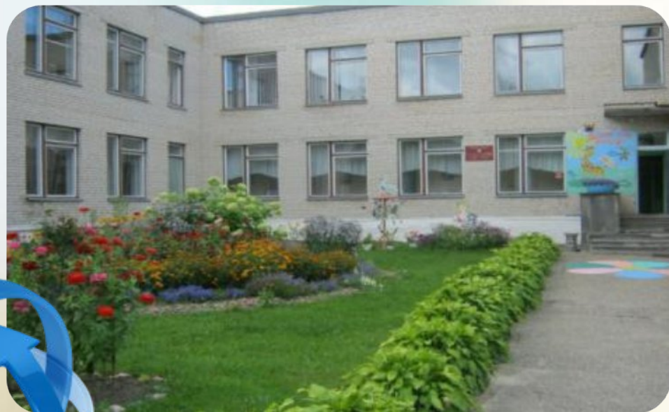
ГУО «Детский сад № 10 г. Витебска»