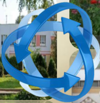
ГУО «Средняя школа № 15 г. Витебска имени М.Я.Чуманихиной»